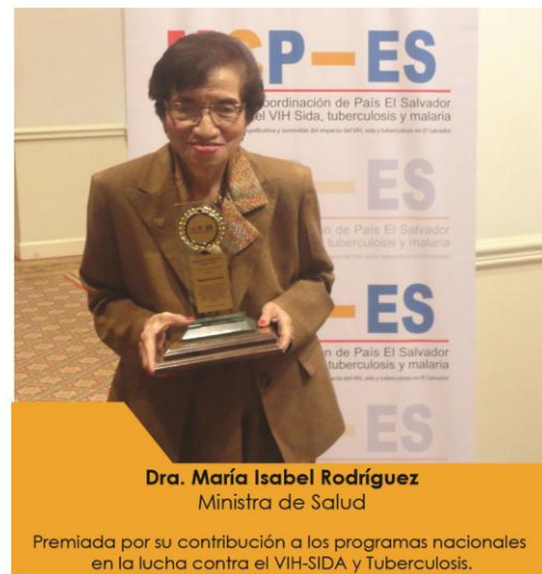
Dra. María Isabel Rodríguez Ministra de Salud

En el área de Tuberculosis previo a 2002 morían el 42.8% de personas que padecían la enfermedad, pero gracias a los programas impulsados por el MCP-ES y el Ministerio de Salud se ha logrado reducir esta cifra a menos del 12% .