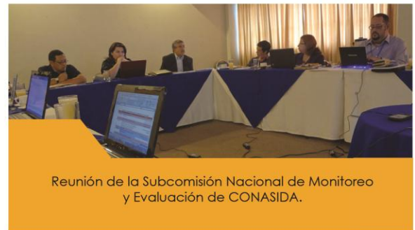
Reunión de la Subcomisión Nacional de Monitoreo y Evaluación de CONASIDA.

El MCP-ES desempeña un rol fundamental en el Plan, ya que tiene un papel de garante de las subvenciones del Fondo Mundial en el país, razón por la que ayudan de gran manera a elaborar actividades y proyectos, y tienen conocimiento amplio de todas las acciones que se llevan a cabo por los dos receptores principales que son el Ministerio de Salud y el Programa Nacional de VIH-SIDA y Tuberculosis del PNUD.