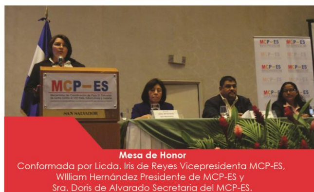
Mesa de Honor

Hasta el año 2003 había una tasa elevada de diagnóstico tardío de VIH-SIDA lo cual se trasladaba a mayor índice de mortalidad, pero desde que se recibe el apoyo del Fondo Mundial a través del MCP-ES se han hecho avances significativos en relación al diagnóstico temprano y tratamiento de la enfermedad, reduciendo de gran manera el índice de mortalidad.