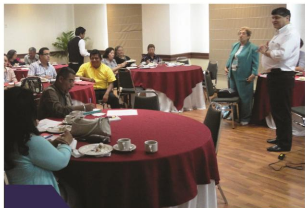
Miembros del MCP-ES, Miembros de Unidades Ejecutoras, Personal de la Dirección Ejecutiva y Personal del Programa Nacional de VIH, durante el taller.

El taller estaba estructurado bajo una metodología participativa, en el que los asistentes pudieron también dar sus opiniones y compartir sus experiencias relacionadas a los temas tratados. Se habló de las dificultades que enfrentan las personas pertenecientes a las denominadas Minorías Sexuales y las posibles formas de contribuir de manera positiva a las situaciones con las que estos tienen que convivir en todos los ámbitos sociales en los que se desenvuelven.