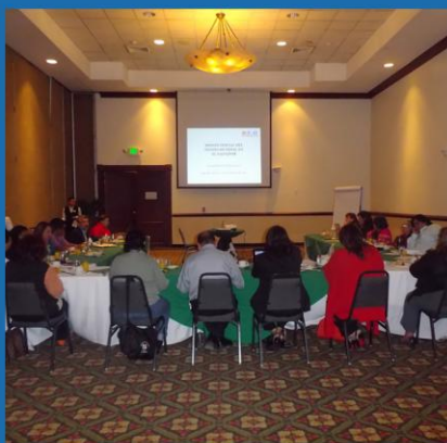
Miembros de Sectores Constituyentes del MCP-ES durante Reu- nión Plenaria 03-2013.

y conocer la visión de los involucrados, esto se logró a través de la instalación de mesas de trabajo que incluyó a las que son consideradas como poblaciones clave dentro de la propuesta y que anteriormente no tenían representación directa en el MCP-ES, pero que a partir de Julio de 2013 tendrán representación permanentes en el Mecanismo.