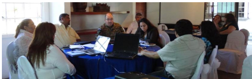
Asistentes a taller de revisión de Plan Estratégico del MCP-ES del 13 de junio.

El Mecanismo Coordinador de País se está preparando para la elaboración del Nuevo Plan Estratégico, correspondiente al periodo 2014-2018. Se están haciendo las gestiones necesarias para recibir apoyo de otras instancias como Iniciativa BACKUP de GIZ para la elaboración de este nuevo documento.