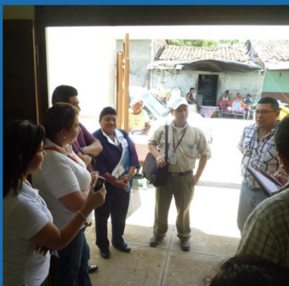
Delegados del MCP-ES y Receptores principales en Visita de Supervisión de Campo Zona Oriental Proyecto TB MINSAL.

personalmente que la atención recibida es oportuna, amable y que las condiciones de salud habían mejorado notablemente en la población afectada desde que se hizo el primer acercamiento con los programas de atención integral que se mantienen en la zona.