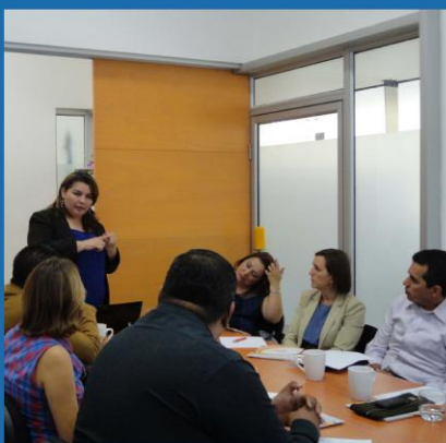
Reuniones para elección de Nuevos Representantes Propietarios y Suplentes del MCP-ES para Periodo 2013-2016