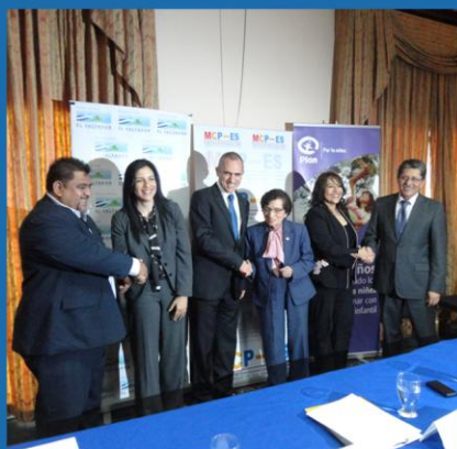
Firma de convenio "Nuevo Modelo de Financiamiento entre Receptores Principales y Fondo Mundial"

diferentes sectores que trabajan en la respuesta nacional a fin de construir la propuesta. Agradeció el acompañamiento del personal del Fondo Mundial durante el proceso de formulación que ahora llega a feliz término así como también a los Organismos de Cooperación ONUSIDA, GIZ, OPS, PNUD, USAID/PASCA, PASMO, entre otros que apoyaron al equipo nacional en todo el proceso, con especial reconocimiento a las organizaciones de sociedad civil que dieron valiosos aportes para la definición de las estrategias a impulsar. El reto para el país es cumplir con las metas propuestas para mejorar las condiciones de salud de las personas con VIH y reducir la epidemia entre los hombres que tienen sexo con hombres, trabajadoras sexuales y personas transgénero. De esta manera vamos a tener un impacto en la epidemia de VIH en El Salvador, acotó.