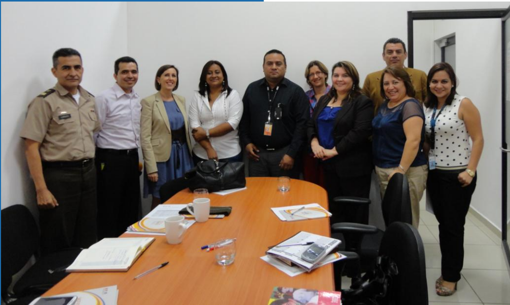
Nuevos Miembros del MCP-ES durante la segunda sesión de Inducción realizada el 25 de Junio.

“Llegué a un espacio del que no conocía nada, luego del proceso, reconozco que he aprendido mucho. En este programa se aprende rápido”