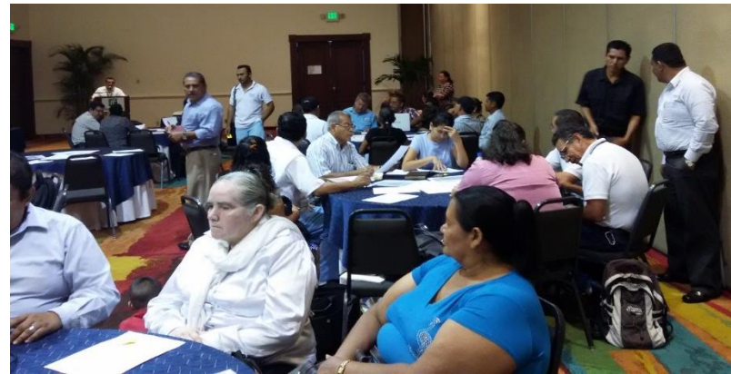
Taller de Evaluación Región Metropolitana / 30 de abril