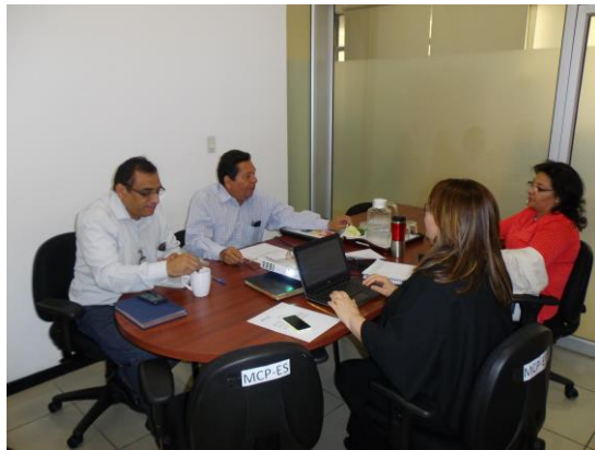
Reunión de equipo de Comité de Propuestas Malaria