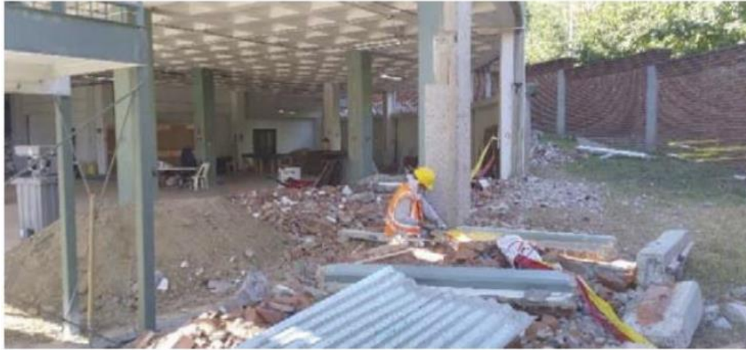
ESCARAIFICADO EN COLUMNAS