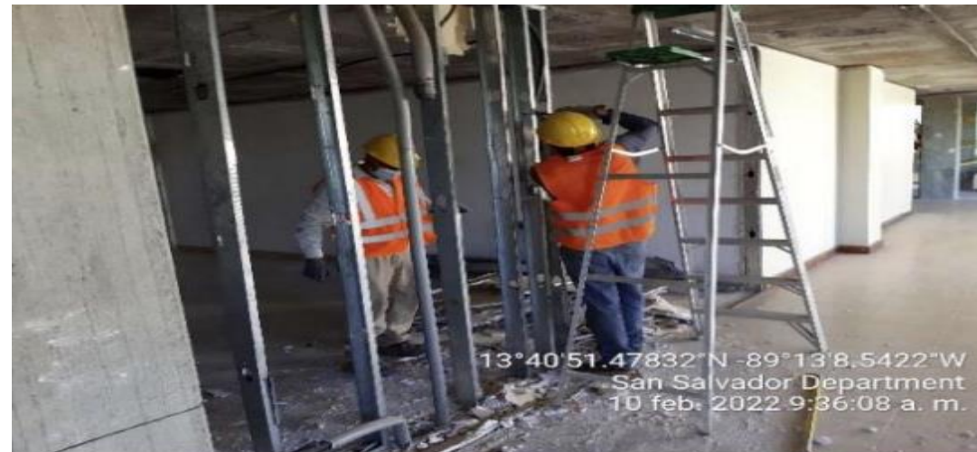
DESMONTAJE MATERIALES ELECTRICOS