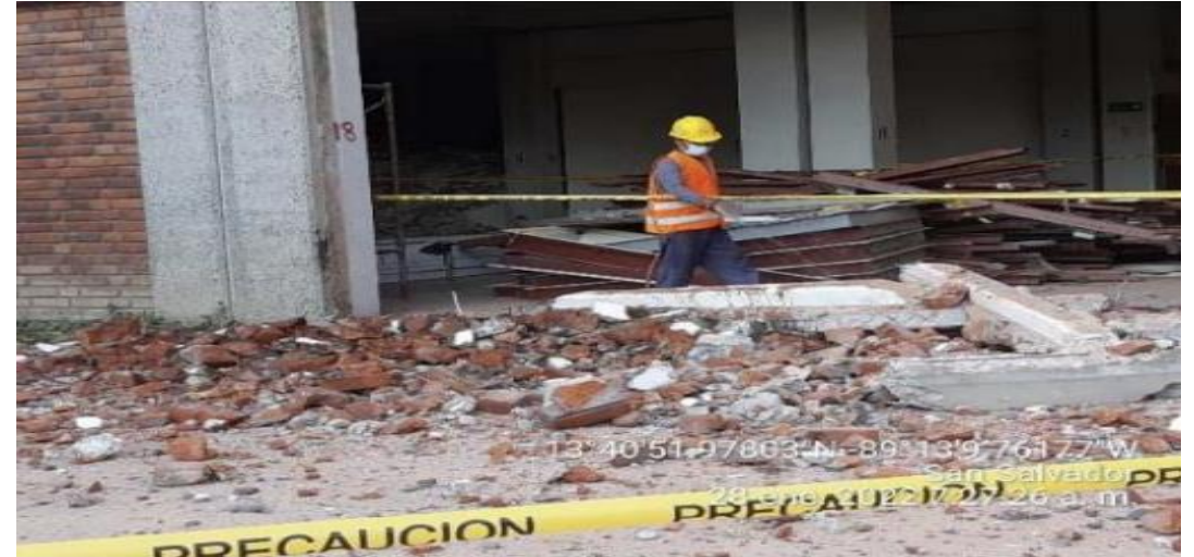
DESMONTAJES Y DEMOLICIONES